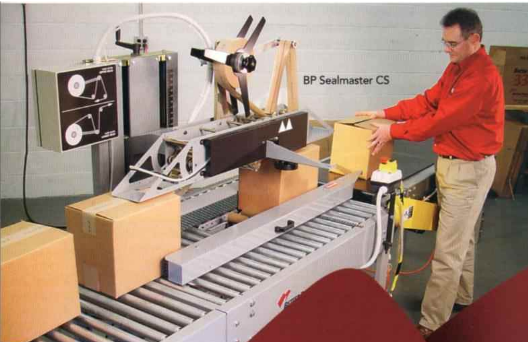
BP Sealmaster CS